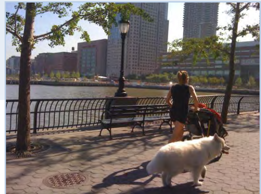
双子をツイン用ベビーカーに乗せて、太った愛犬を連れて、朝のランニングを欠かさないニューヨーク・ママって凄い！