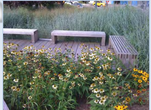
My resting bench, 散歩道に見つけた憩いのベンチ