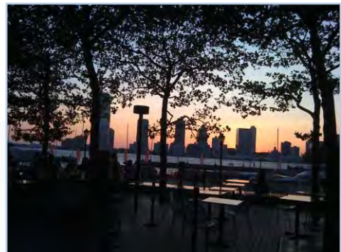
陽の沈む頃、河辺は毎日 違った終日の光景を描く。