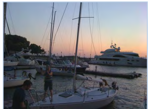
夕刻、セーリングから戻って来るボートで賑わう。